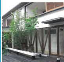
ホテルアレグリア ガーデンズ天草